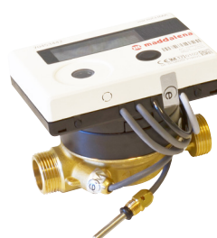
Energimätare RSK 5188219