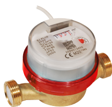
Vattenmätare RSK 5183775