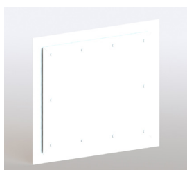
Vätzonslucka RSK 4648095