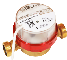
Vattenmätare RSK 5184030