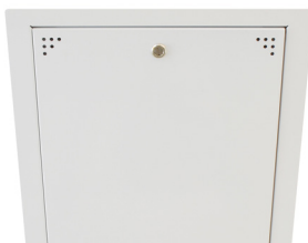
Lucka för takmontage exempelbild