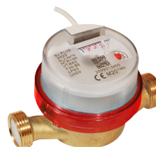
Vattenmätare RSK 5183775