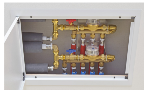
Exempel på installation